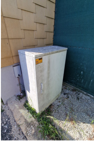
Anschlüsse Nachbargrundstück Süssenbrunn